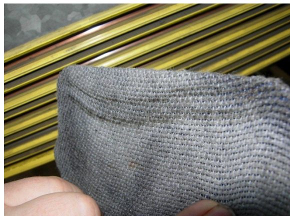
Afbeelding 7: Opgenomen vuil