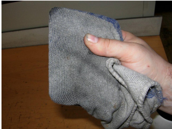
Afbeelding 4: Reinigingsgereedschap