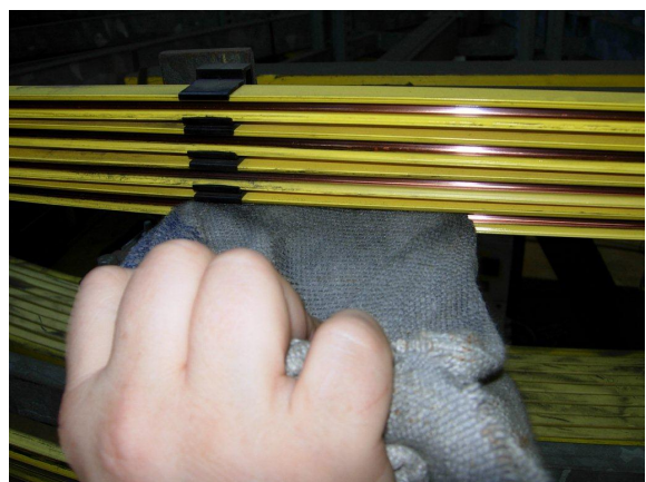
Afbeelding 9: Ook vuil dat op de railhouders aanwezig is, verwijderen