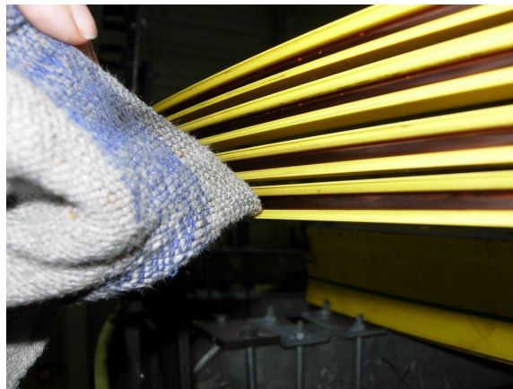
Afbeelding 11: Contacthoek voor het reinigen van de onderste zone