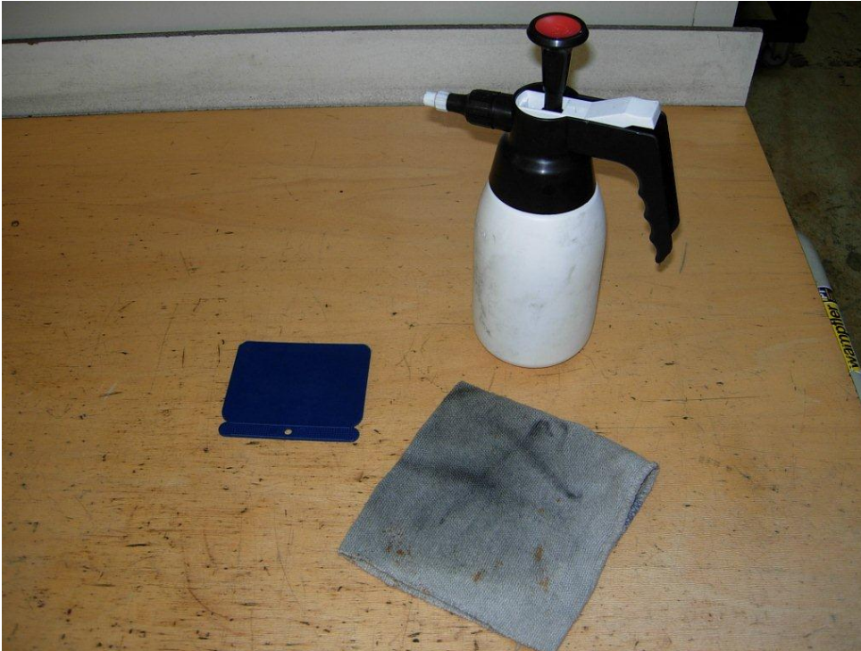
Afbeelding 1: Gereedschappen (doeken, spatel, en reiniger)