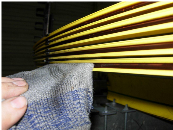
Afbeelding 10: Contacthoek van het reinigingsgereedschap wijzigen om verschillende zones te reinigen