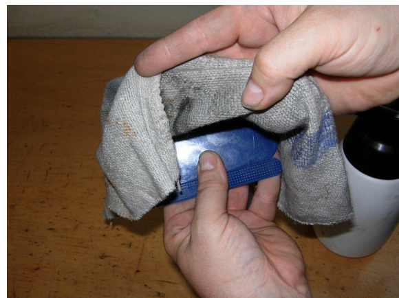
Afbeelding 3: Breng een doek aan over de spatel