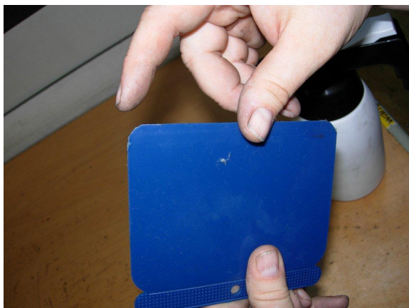
Afbeelding 2: Spatel met afgeronde hoeken