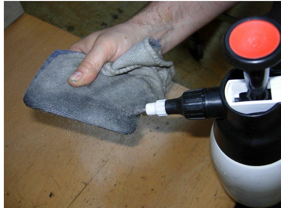
Afbeelding 5: Doek vochtig maken

Ga met de vochtige doek door de contactopening door de sleepleiding. Daarbij wordt het vuil opgelost en opgenomen: